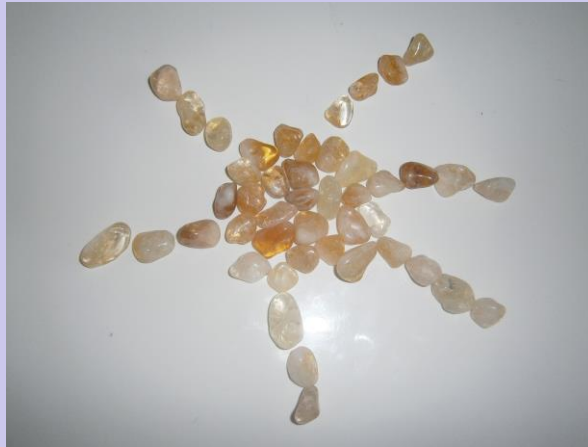
Citrínové andělské sluníčko.

Pod vedením archanděla Rafaela, krystalu Citrín a Archanděla Gabriela. ☺